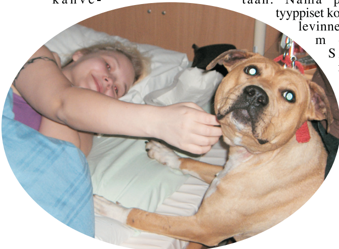
Aito amerikanpitbullterrieri, terapiakoira parhaimmillaan. Koira on ihmisen paras kaveri ja amerikanpitbullterrieri on todella lempeä sellainen.

Epäselvissä rekisteriasioissa voit aina ottaa yhteyttä SATHY ry.:hyn, selvitämme asian puolestasi. Nyrkkisääntönä kuitenkin sanottakoon, että jos koiralla ei ole papereita, se ei ole pitbulli, vaikka voissa paistaisi, tästä syystä koiran rotu kannattaa tarkistaa ennen hankintaa. Jälkikäteen koiran rotua on mahdoton muuttaa.