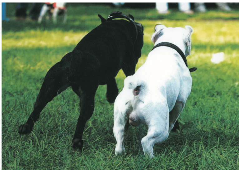
Vasemmalla patterdalerterrieri, oikealla jackrusselinterrieri. Koirat ovat liikkeessä, mutta kuvasta näkee hyvin koirien välisen fyysisen eron.