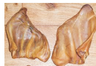
Possunkorva, XL 28,50 €/50kpl