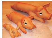
Kumipossu alk. 2,47 €/kpl