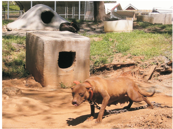
Oman koiramme emo, ihana, kiltti, todella hieno koira, Chocolata.

Aluksi meitä hieman arveltutti kuinka molemmat koiramme tulisivat toimeen keskenään. Vaikka pitbullit ovat kuuluisia siitä, että he rakastavat kaikkia ihmisiä, ei välttämättä tarkoita, että he ovat samaa mieltä lajikumppaneis-