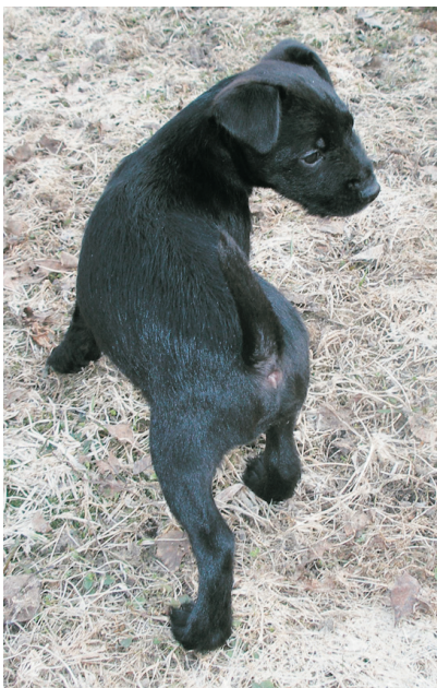
Patterdalerterrierin yleisin väri on musta. Metsästäjät pitävät mustasta väristä koska se on eniten villieläimistä erottuva väri metsällä oltaessa.

Niskan tulee olla lihaksikas ja oikeassa suhteessa päähän ja kroppaan.