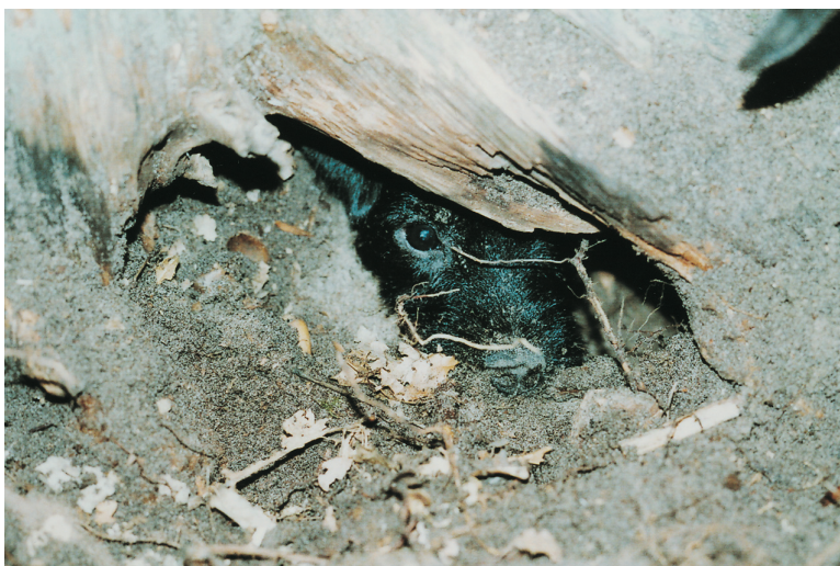
Bürste patterdalerterrieri kettuluolassa.