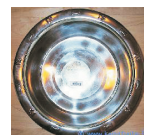
Teräskuppi, 4,5 lit. 10,35 €/kpl