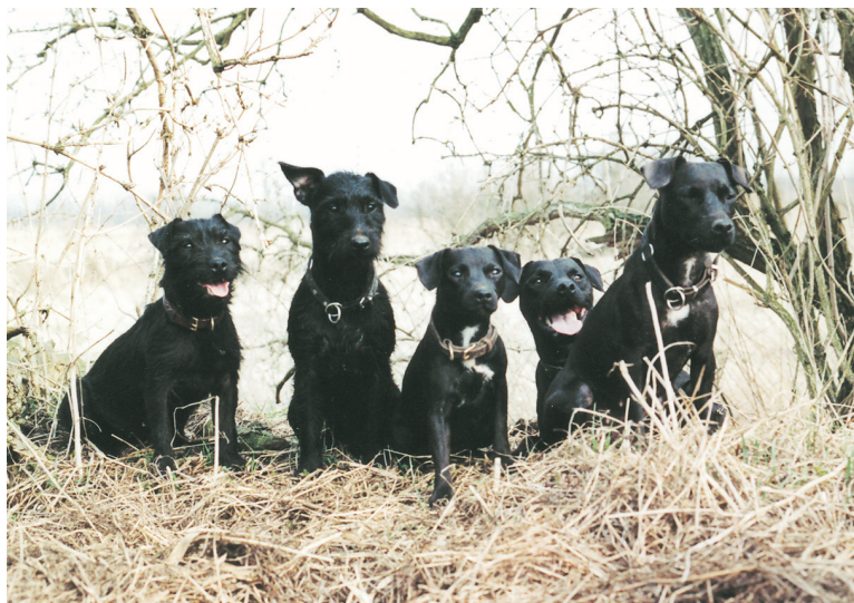
Kuvassa kaksi urosta ja kolme narttua. Patterdalerterrierin ei tule missään nimessä olla aggressiivinen muita koiria kohtaan, sillä metsällä saaliin perässä on usein monta koiraa samoissa maan alaisissa luolissa. Jos koirat ryhtyisivät nahistelemaan keskenään, jäisi metsästäminen siihen.