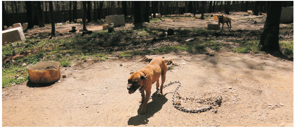
Tomini pitiyardi oli vähintäänkin siisti, koirat hyvässä kunnossa, reippaita, terveitä, hyvässä hoidossa. Tällaisesta kennelistä koiran ostaminen on silkka ilo!

Hän tiesi missä meidän motelli sijaitsi ja sanoi, että olemme noin viidentoista minuutin päässä hänen kodista. Kirjoitin ajo-ohjeet ylös, jonka jälkeen lopetimme puhelun ja me menimme saman tien nukkumaan.