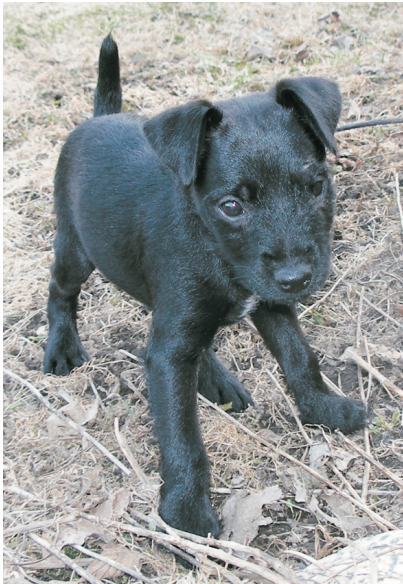
Untti, patterdalerterrieri-pentu, ihmettelemässä Suomen kevättä.

johda hylkäämiseen eikä niitä nähdä huonona asiana.