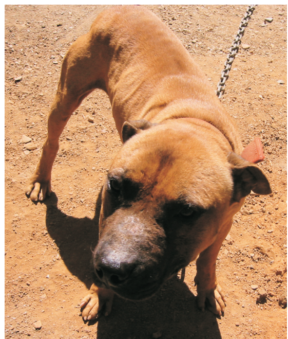
Oman koiramme isä, superupea, komea, kuuluisa CH Dynamite.