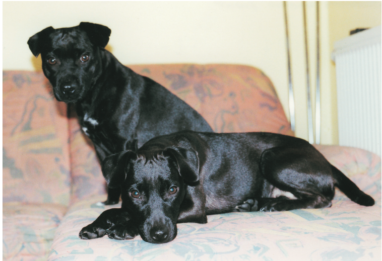
Patterdalerterrierit Wursel (takana) ja Gnome (edessä). Eurooppalaisia huippu-patterdalerterriereitä Eurooppalaisesta kennelistä. Molempien koirien linjoista löytyy puhtaasti pelkästään Nuttallin koiria.

Koira ei saa olla arka, ujo tai agressiivinen. Tällaiset koirat hylätään näyttelyssä eikä tällaisia koiria tulisi käyttää jalostuksessa.