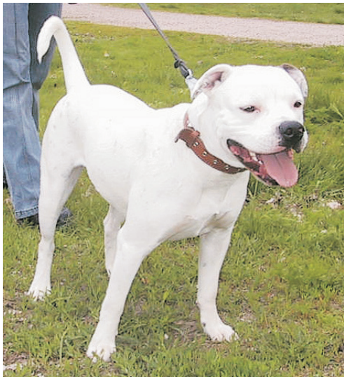
Meikäläinen lähtee SATHY Kevätkinkereille tapaamaan muita amerikanbulldoggeja ja koirakavereita! Tule Sinäkin!

Lisäksi SATHY Kevätkinkereillä järjestetään lisäksi leikkimielinen kisa palkintoineen koirapussijuoksussa ja pienten koirien nopeusjuoksussa. Koirapussijuoksu on nopeatempoinen, hauska laji koirille ja omistajille. Nopeusjuoksu on ollut