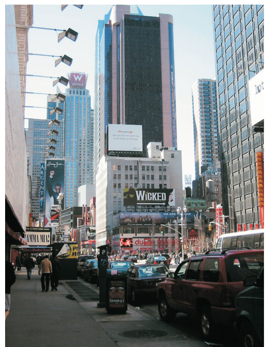
Katunäkymää New Yorkissa.

Tehtävänä oli löytää valtatie 95, jota pitkin pääsisimme Pohjois-Carolinan osavaltioon. Ajoimme ulos Manhattanilta